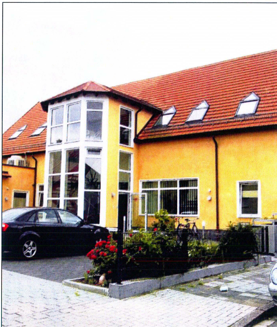
In Edigheim befindet sich der Firmen-Hauptsitz.

Groß geworden ist Peters Engineering „mit und dank der BASF“, wie Heim sagt. Neben dem Stammsitz in Edigheim unterhält das Ingenieurbüro Außenstellen auf dem Gelände der BASF, in Oppau, Duisburg und in Ingelheim. Auch in Frankreich und